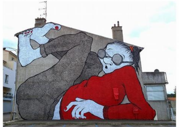
ELLA ET PIR, COLOSSE , PEINTURE SUR MUR, ART URBIN.