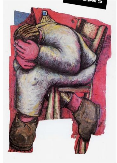
JEAN-CHARLES BLAIS, ASSIS EN ROUGE , 1984, 350X280 CM, PEINTURE SUR CROUTE D'AFFICHES DÉCHIRÉE.