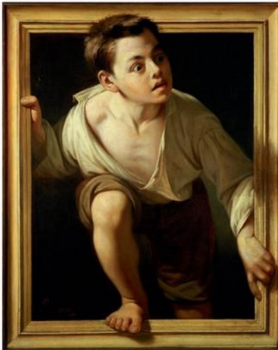
PERE BORRELL DEL CASO, ESCAPANDO DE LA CRITICA , HUILE SUR TOILE, MADRID, 1874.