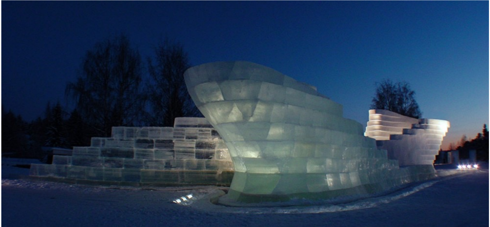
Zaha HADID et Cai GUO-QIANG, The Snow Show , 2004