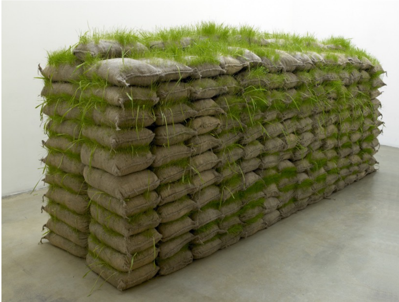
Mona HATOUM, Jardin suspendu , 2008, sacs de sable, herbe