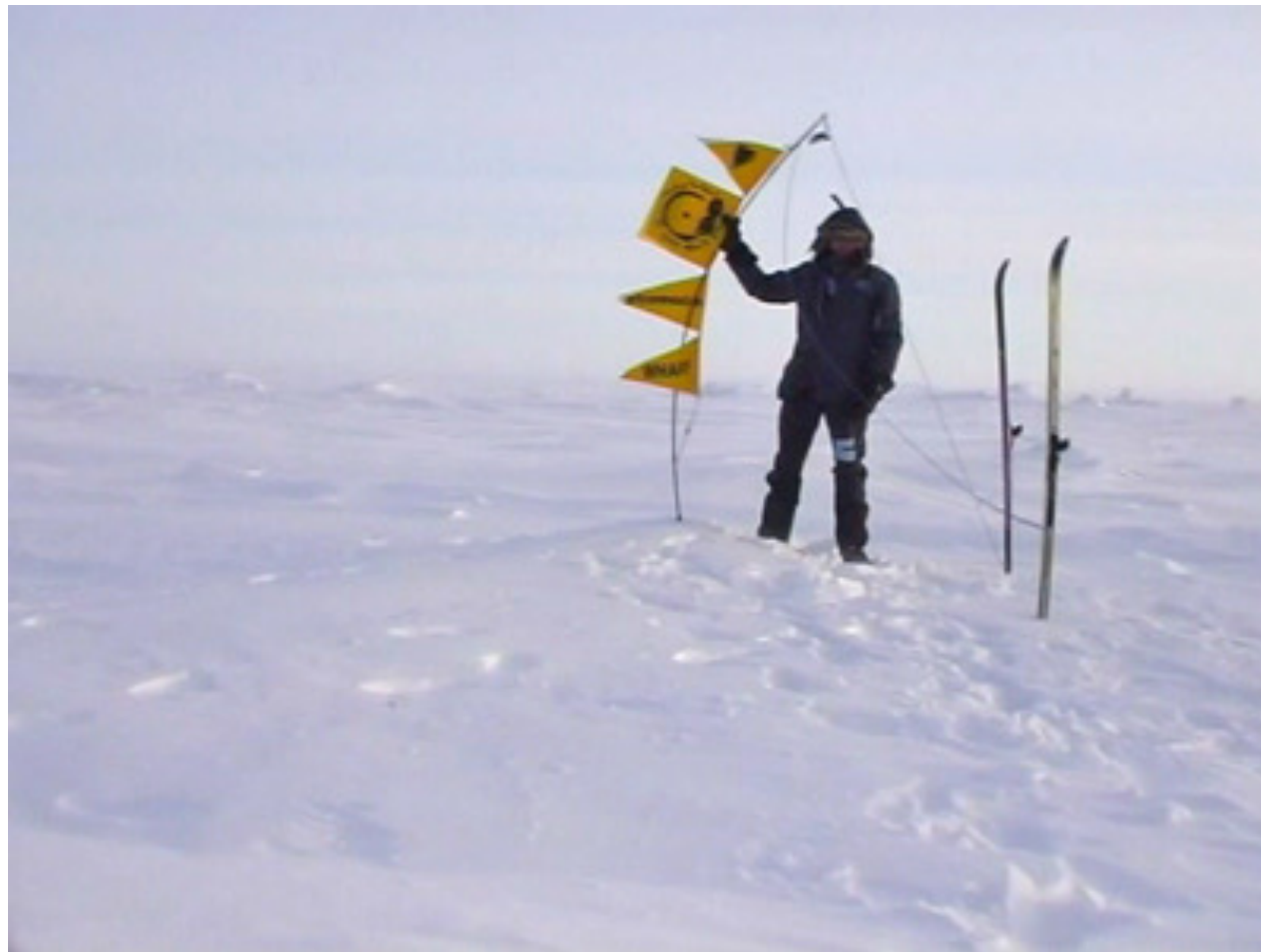
Laurent TIXADOR, North Pole , 12 avril 2005, expedition-performance