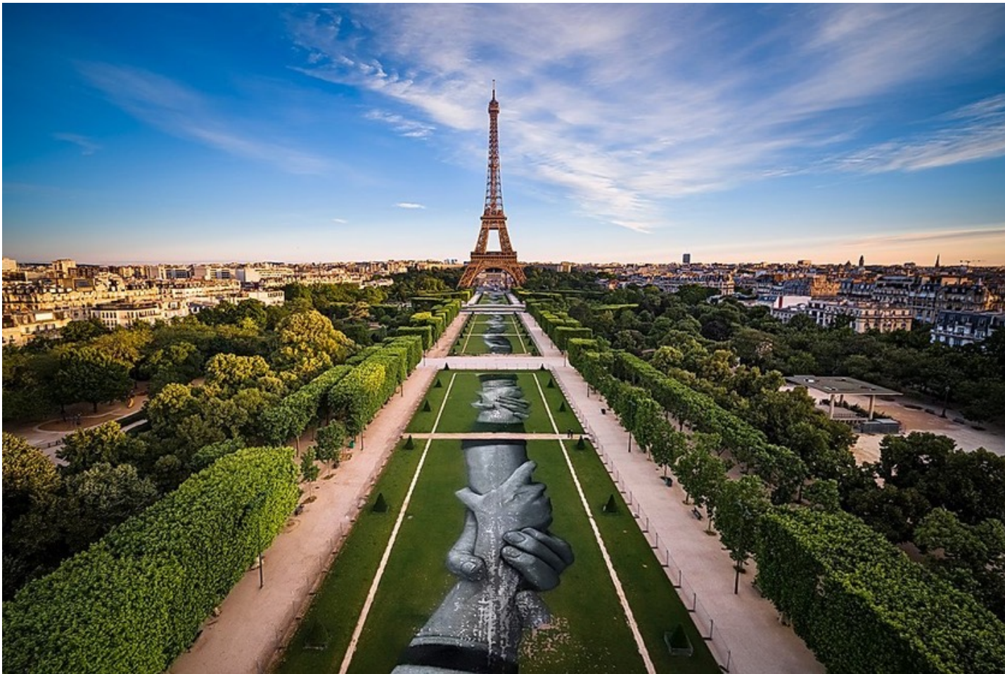
SAYPE, Beyond Walls, Step 1 : Paris , Peinture biodégradable sur herbe, 15.000m 2 , Paris (FR) 2019.