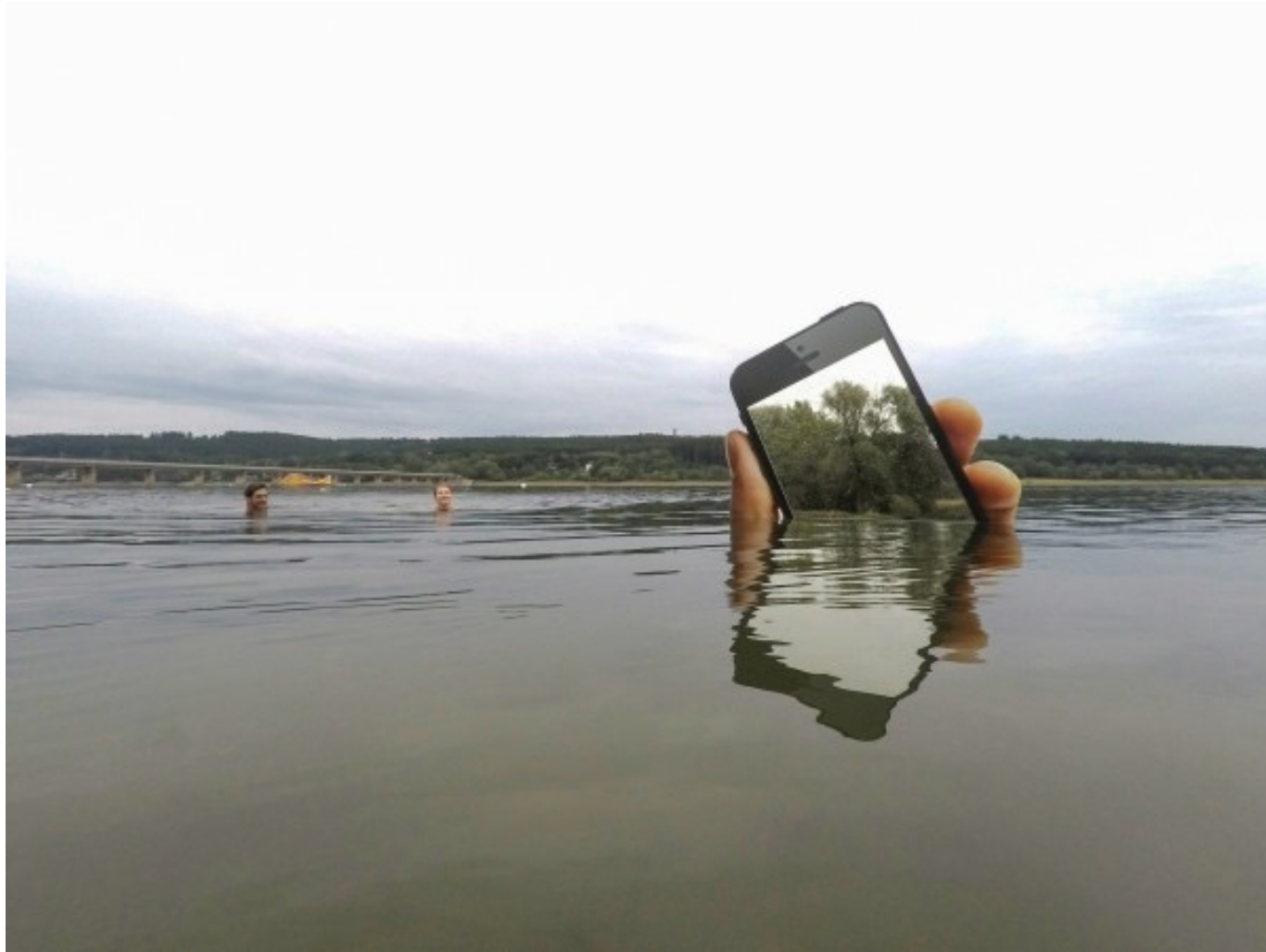
Aram BARTHOLL, Obsolete Presence , site specific installation, 2017.