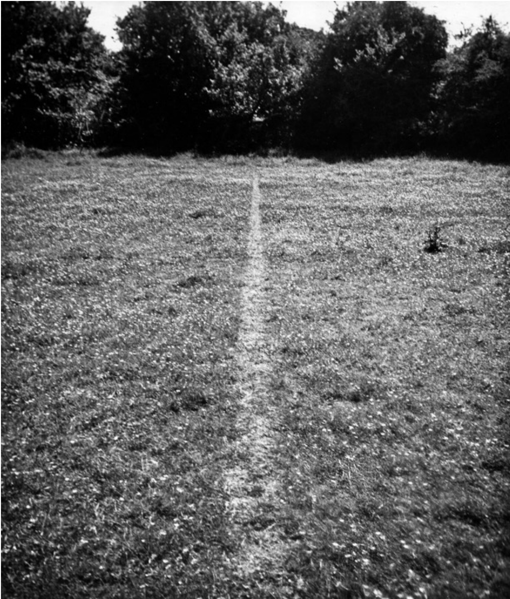
Richard LONG, A Line Made by Walking , 1967, Angleterre