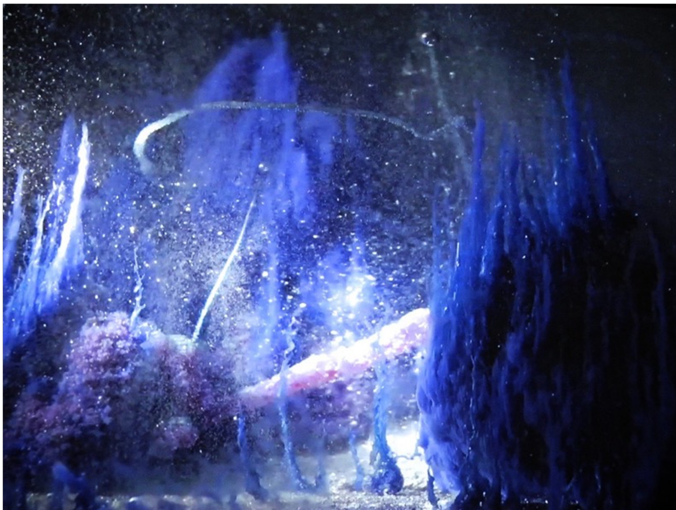
Hicham BERRADA, Présage , 2007.