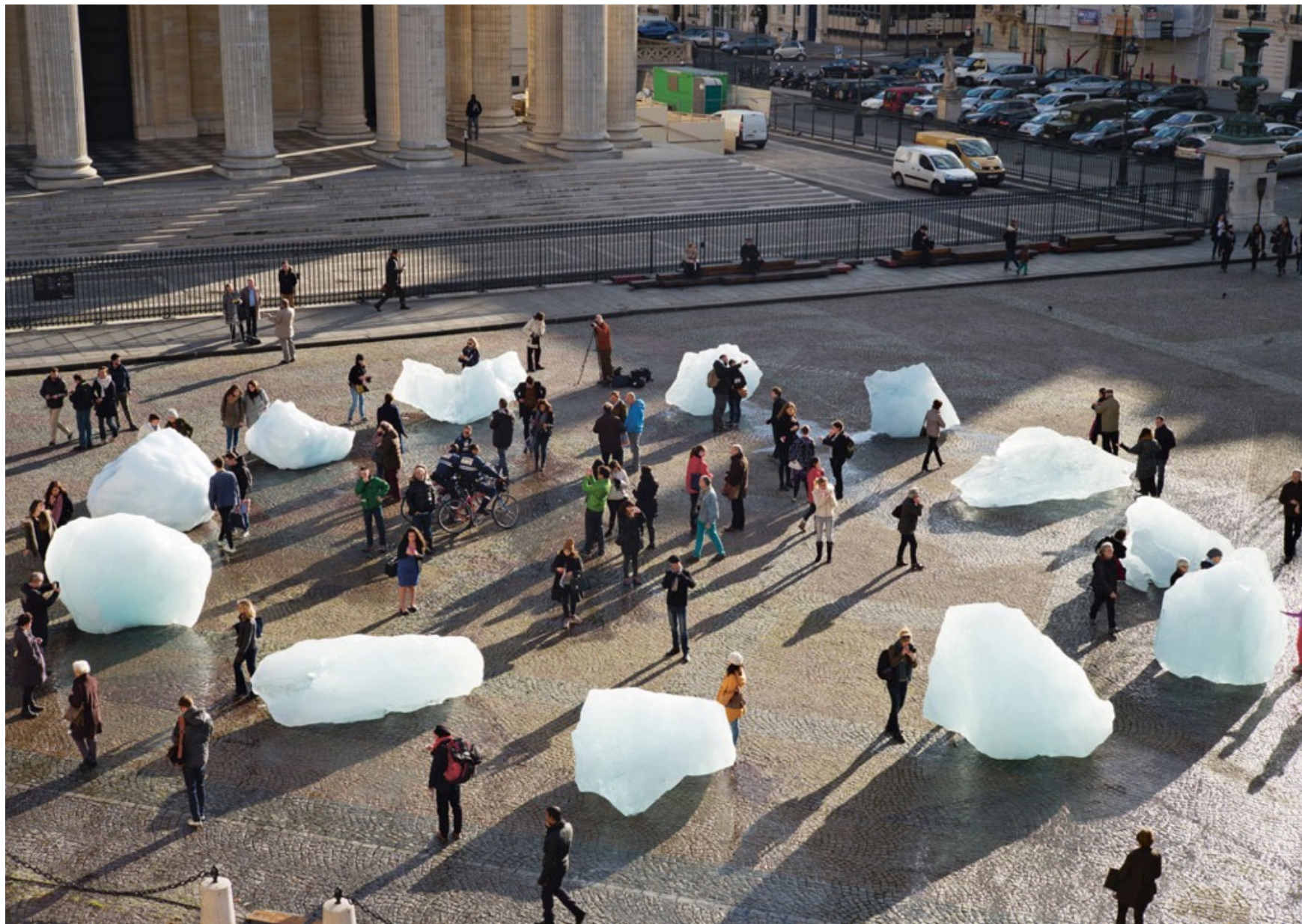
Olafur ELIASSON, Ice Watch , 2014, Place du Panthéon, Paris, 2015.