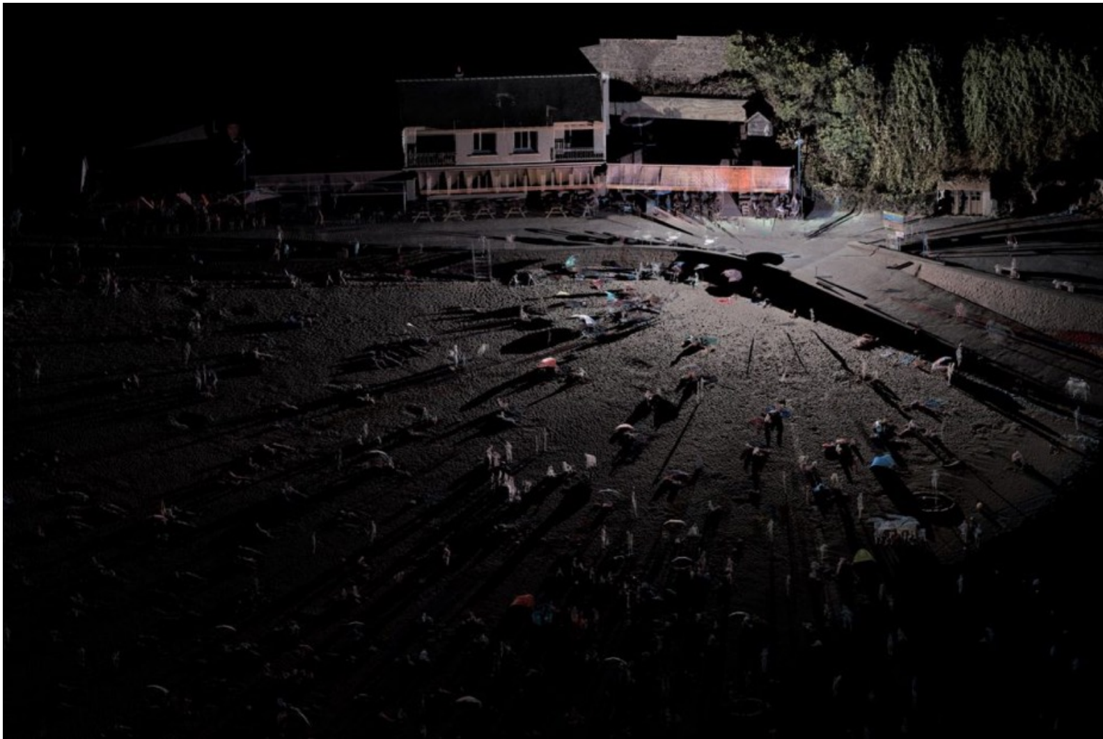
Thibault BRUNET, Territoires circonscrits , 2016.