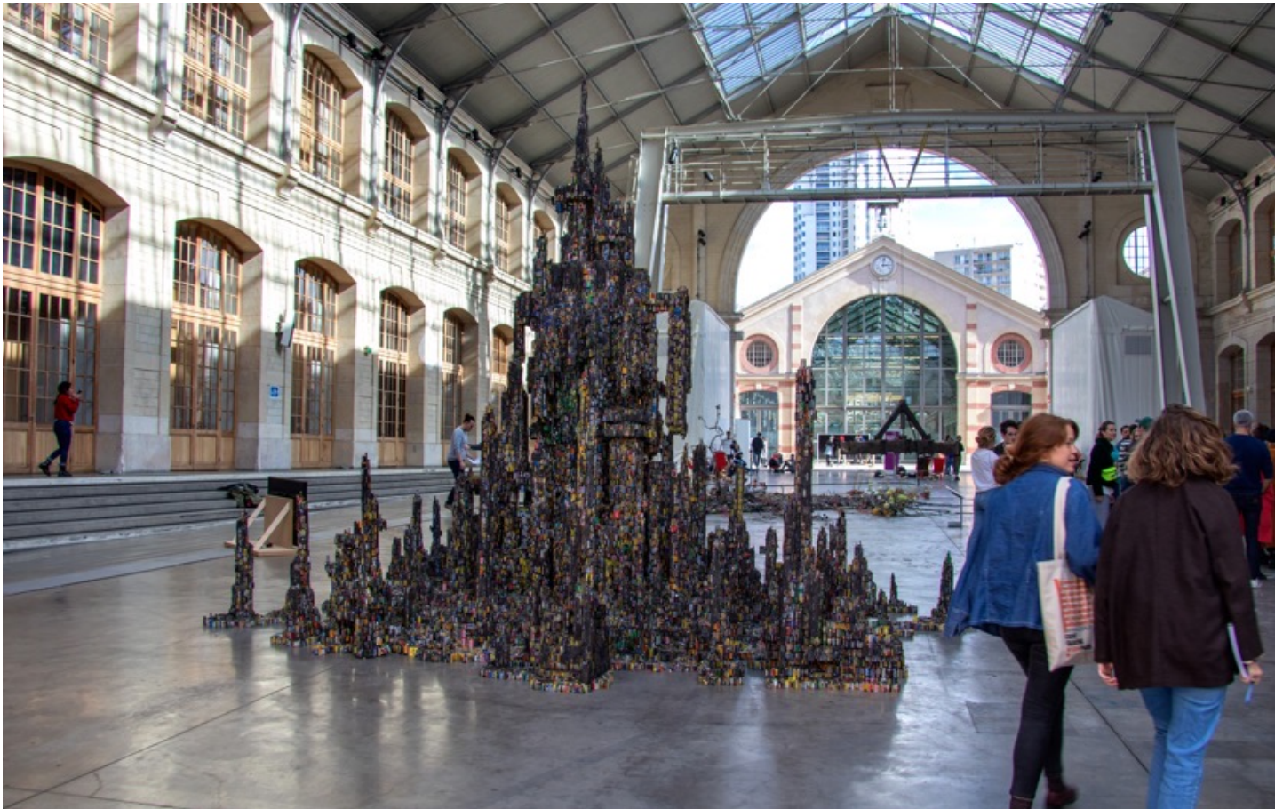
Krištof KINTERA, Post-naturalia, Out of Power Tower , structure en fer, bois, piles, 4,3 x 5,4 x 6 m.