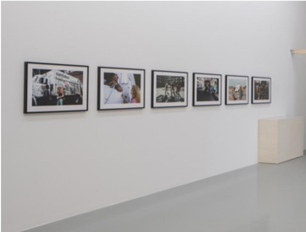
Mierle LADERMAN UKELES, Touch Sanitation , Performance, 1977-1980/2007, Photographies couleur, 40,6 x 61 cm chaque.