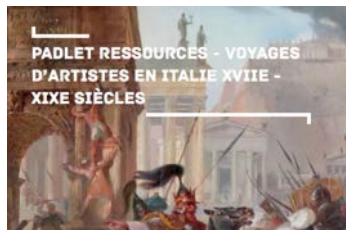
Arts, ville, politique et société : le voyage des artistes en Italie, XVIIe-XIXe siècles