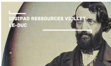
Un artiste en son temps : Eugène Viollet-le-Duc (1814-1879)

Baccalauréat Histoire des arts : Programme limitatif pour l'enseignement de spécialité d'histoire des arts en classe terminale pour l'année scolaire 2023-2024