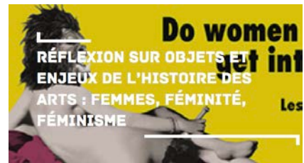
Objets et enjeux de l'histoire des arts : femmes, féminité, féminisme

L'ensemble des ressources pédagogiques, coordonnées par Sophie Delauney, chargée de mission en Histoire des arts et référente académique Domaine patrimoine (DAAC) sont consultables et téléchargeable depuis le site académique (webmestre : delphine.hue@ac-normandie.fr )