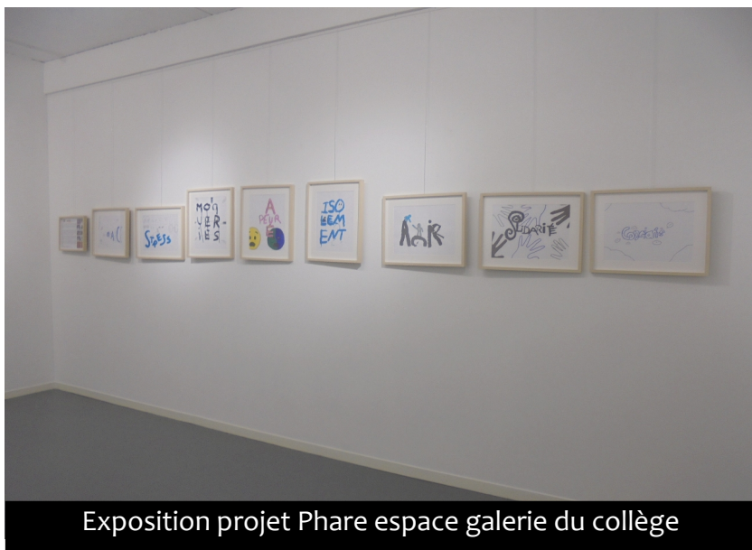
Exposition projet Phare espace galerie du collège