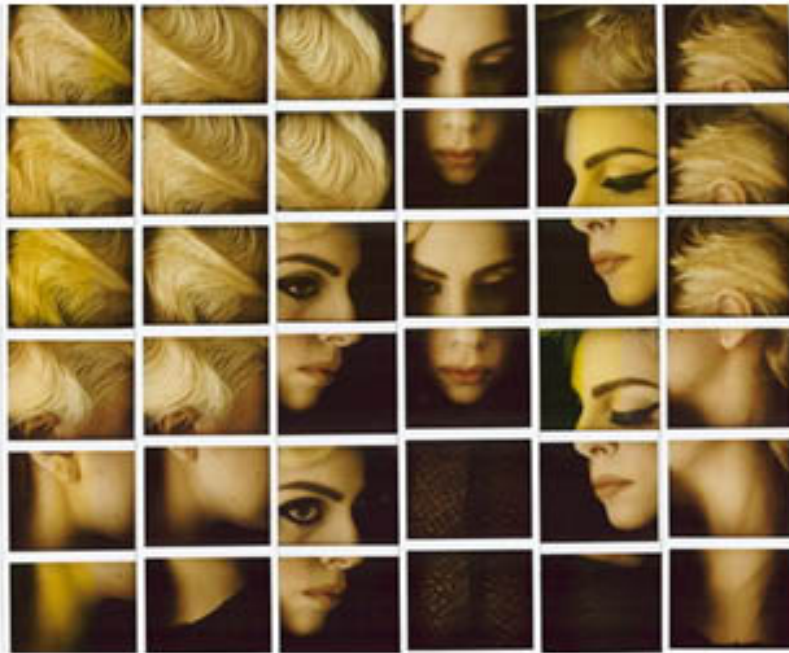
GALIMBERTI Maurizio Lady Gaga 2003 Mosaïque de Polaroids Dorothy's Gallery Paris

Dans son oeuvre Place Furstenberg , David Hockney décompose l'espace urbain en une multitude de photographies prises sous des angles et des instants différents. Cette fragmentation rompt avec la perspective unique de la photographie traditionnelle. La recomposition, par collage, assemble ces fragments pour construire une vision éclatée et dynamique du lieu, donnant à voir l'espace comme une expérience visuelle multiple et temporelle.