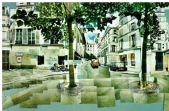
David Hockney Place Furstenberg, 1985 Photocollage 110,5 x 155,9 cm Collection de l'artiste, Los Angeles

Dans son oeuvre Place Furstenberg , David Hockney décompose l'espace urbain en une multitude de photographies prises sous des angles et des instants différents. Cette fragmentation rompt avec la perspective unique de la photographie traditionnelle. La recomposition, par collage, assemble ces fragments pour construire une vision éclatée et dynamique du lieu, donnant à voir l'espace comme une expérience visuelle multiple et temporelle.