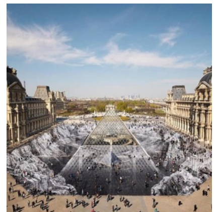
JR, Le secret de la Grande Pyramide , installation participative du 26 au 31 mars 2019, collage photographique, 17 000 m 2 dans la cour Napoléon, auquel 400 volontaires ont contribué. Pyramide du Louvre, Paris, France.