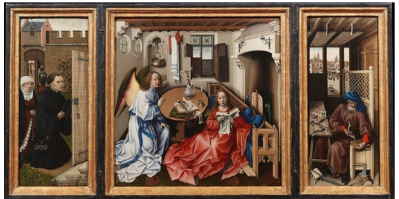
Robert CAMPIN, Triptyque de l'Annonciation (autel de Mérode) , 1427-1432, huile sur panneau de chêne, 64,1 x 63,2 cm (panneau central), 64,5 x 27,3 cm (chaque panneau latéral). The Metropolitan Museum of Art, New York, États-Unis.