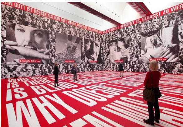
Barbara KRUGER, Untitled (Sans titre) , 1994-1995, dimensions variables, installation de sérigraphies photographiques sur papier. Museum Ludwig, collection Ludwig, Cologne, Allemagne.

Je dégrafe les pages pour voir les quatre œuvres en même temps.