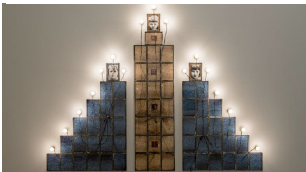
Christian BOLTANSKI, Monument , 1987, 65 photographies noire et blanc et couleur, 17 lampes électriques, variateur et câbles électriques, 183 x 238 cm. Le Carré d'Art, musée d'art contemporain, Nîmes, France.