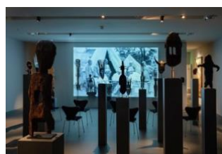
Kader ATTIA, Les Entrelacs de l'Objet / The Object's Interlacing , 2020, Installation with video (color, sound) and 22 objects (3D nylon prints and wooden copies of African artifacts).