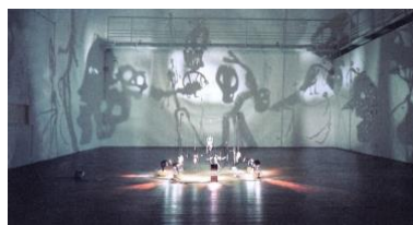
Christian BOLTANSKI, Théâtre d'ombres , 1995-1990, figurines en carton, papier, laiton, fil de fer, projecteur et ventilateur.