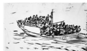
Adel ABDESSEMED, Lampedusa , 2014, fusain sur papier, 85 x 133 cm.