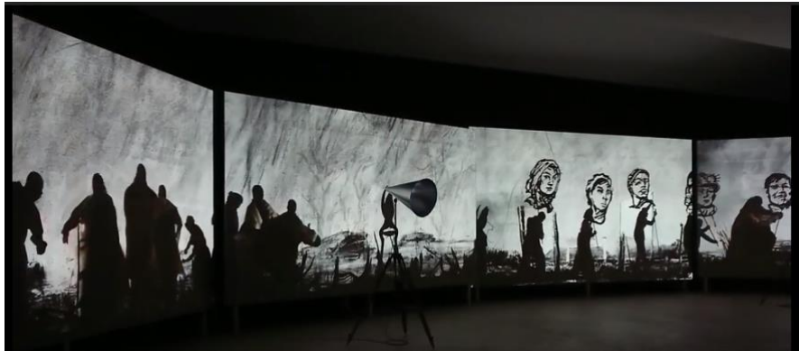
William Kentridge (1955- ), More Sweetly Play the Dance (Jouer la danse plus doucement) , 2015, dimensions variables, installation vidéo 8 canaux haute définition, 15 min, avec 4 porte-voix, Ottawa, musée des beaux-arts du Canada.