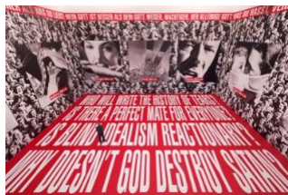
Barbara KRUGER, Untitled (Sans titre), 1994-95, dimensions variables, installation de sérigraphies photographiques sur papier, Museum Ludwig, Cologne.