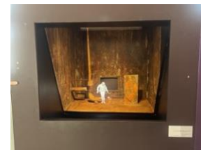
Pierrick SORIN, VPIM (visualiseur personnel d'images mentales) , 2003, téléviseur, lecteur DVD, miroir espion, caisson bois 50 x 160 x 100 cm.