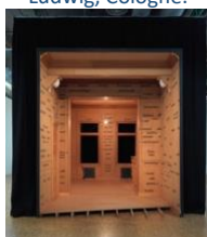
Marcel BROODTHAERS, Salle blanche , 1975, bois, aggloméré, photographie contrecollée sur contreplaqué, peinture sur bois, plâtre, métal, mousse de polyuréthane, ampoule électrique, 390 x 350 x 658 cm.